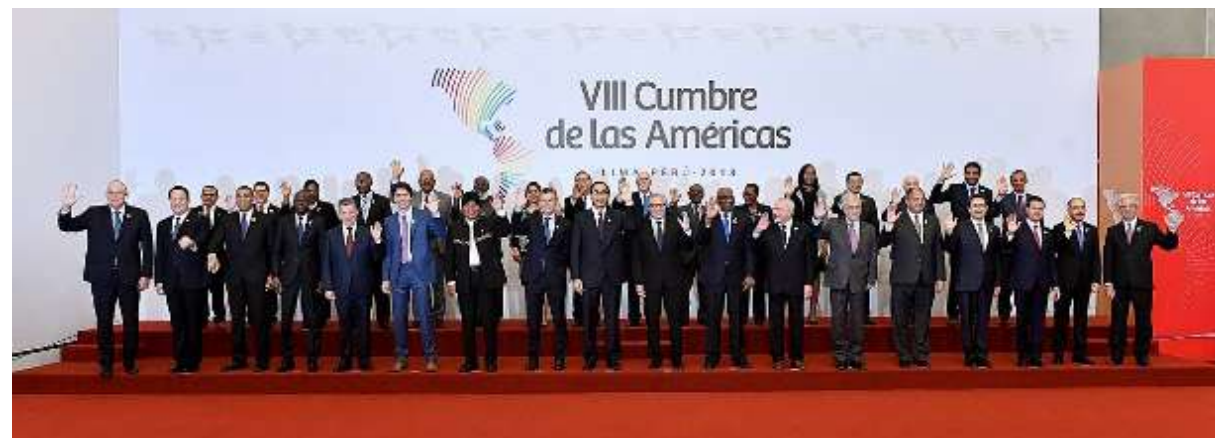
Foto oficial de la VIII Cumbre de las Américas, OEA.

Tanto en las Cumbres de las Américas como en las Iberoamericanas de Jefes y Jefas de Estado y de Gobierno se identifica una presencia minoritaria de las mujeres en la máxima representación de los gobiernos.